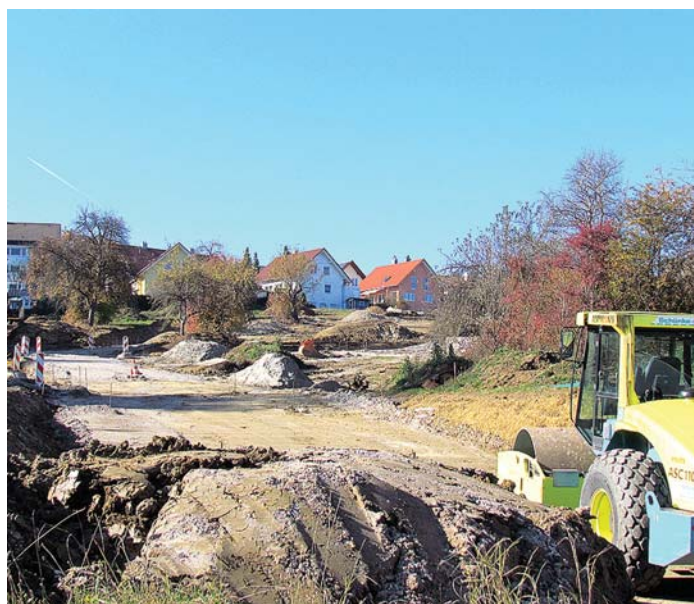
Die Erschließung des Baugebiets Glockenziel III schreitet voran. In seiner jüngsten Sitzung beschloss der Gemeinderat ein zweistufiges Investorenauswahlverfahren für die Bebauung entlang der Mundingstraße.