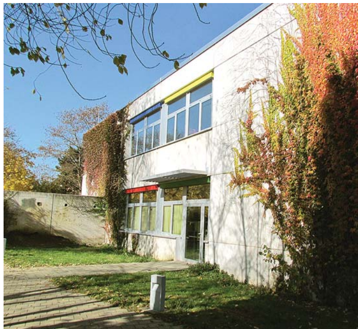
Der geplante Erweiterungsbau in Form eines Riegels soll an die Südseite der Grundschule Engen anschließen.

ner fest und verwies auf steigende Schülerzahlen aufgrund der Neubaugebiete. Auch wenn die Maßnahme ursprünglich nicht in dem nun vorliegenden Umfang erwartet worden sei, müsse sie dringend umgesetzt werden. »Allerdings sollten die geplanten Projekte Petersfelshalle Bittelbrunn und Sanierung der bisherigen Stadthalle nicht verzögert, sondern parallel realisiert werden«, mahnte Steiner. Steiners Wunsch, die Kernzeitenbetreuung aus dem Container ins Schulgebäude zu verlegen, unterstrich auch Fraktionskollege Peter Kamenzin . CDU-Fraktions Sprecher Jürgen Waldschütz zeigte sich in zweifacher Hinsicht überrascht: zum einen, wie rasch die Planung des Anbaus erfolgt sei, zum zweiten von der Höhe der Baukosten. Gleichzeitig sah Waldschütz Grund zu Stolz und Freude: »Die Stadt Engen wird immer mehr zum erstklassigen Bildungsstandort im Oberen Hegau. Da alle Schularten vor Ort präsent sind, müssen Schülerinnen und Schüler Engen nicht mehr verlassen.«